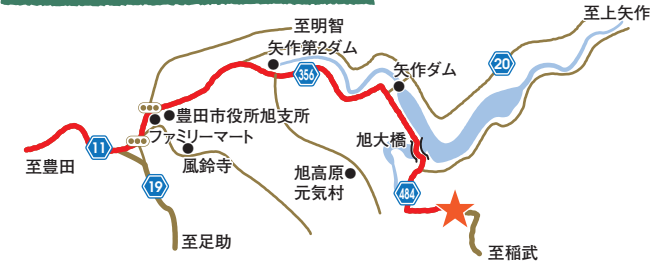
東海環状自動車道 豊田勘八I.Cから車で約50分