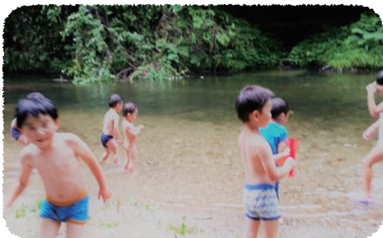
溪流荘 従業員一同

カントリーレストラン溪流荘は、昭和49年に創業の、段戸川沿いに静かにたたずむ季節料理のお店です。地元のお山で採った山菜やきのこを中心にしたお料理は、多くのお客様にご好評いただいております。 また、夏には、川床での鮎料理のほか、バーベキュー、川遊びなど自然とふれあいながら一日を過ごしていただけます。 お子様からお年寄りまで、みんなが笑顔になれるお店を目指して、今後も努力してまいります。どうぞよろしくお願い致します。